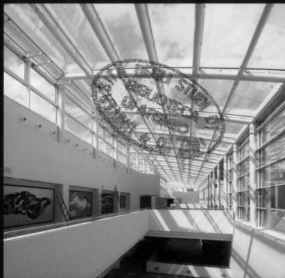
POLO PEDIATRICO MEYER - FIRENZE