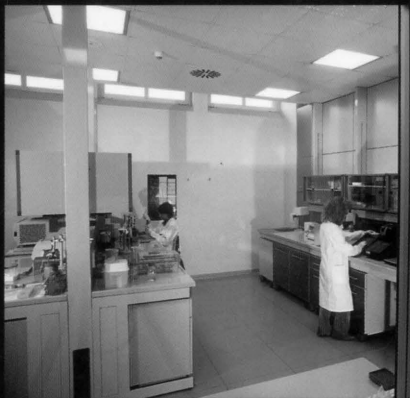
BIOREP - MILANO

EDIFICI E TECNOLOGIE PER LA CURA, L'ASSISTENZA E LA RIABILITAZIONE